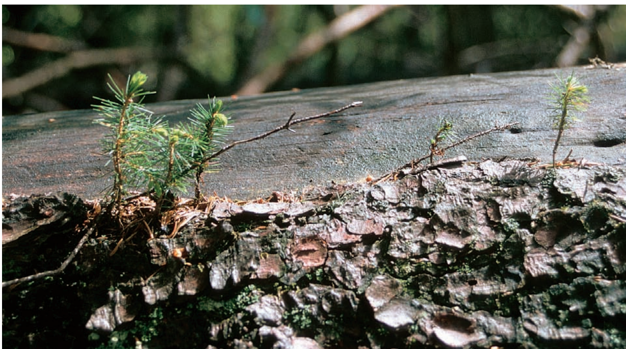
Abbildung 4: Naturverjüngung in Bergwäldern wird durch Totholz erleichtert.

Drittens hört man auch, dass viel oder sogar zu viel Alt- und Totholz in den Wäl-