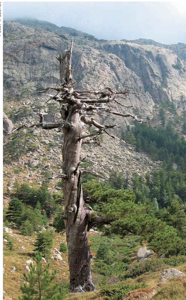
Abbildung 6: Der dicke, tote Baum verleiht dieser Landschaft noch einen zusätzlichen Hauch von Wildnis und verstärkt das Naturerlebnis des Wanderers.