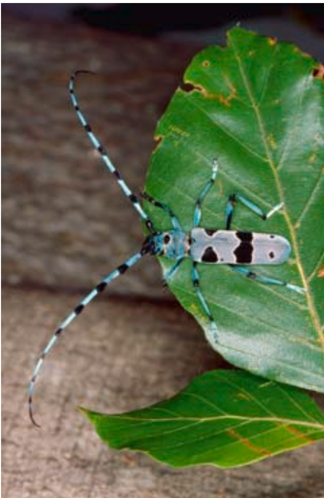
Abb. 1. Ein stattliches Männchen ruht in der Nähe eines Buchenholzlagers (Bild B. Wermelinger).

Der Alpenbock, einer der schönsten, grössten und seltensten Käfer der Schweiz, lebt im Buchenwald, der in Mitteleuropa wahrlich kein seltener und gefährdeter Lebensraum ist. Aber Rosalia alpina braucht für die Entwicklung der Larven über mehrere Jahre totes Buchenholz, das zudem von der Sonne beschienen sein sollte. Wo in der Schweiz Buchen wachsen, wohnen seit Generationen auch Menschen, die das Buchenholz intensiv nutzen.