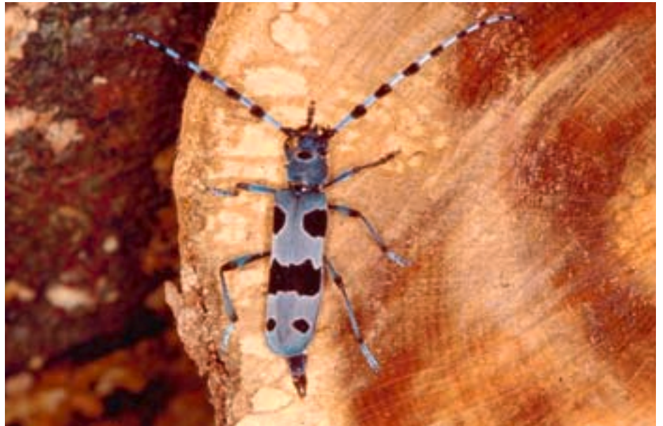
Abb. 5. Ein Weibchen tastet mit seiner Legeröhre die Schnittfläche eines Buchenstamms nach einer geeigneten Eiablagestelle ab.

den: Die Fühler der Weibchen (Abb. 5) sind nur wenig länger als der Körper, während diejenigen der Männchen (Abb. 1, 6) fast doppelt so lang sind. Zudem sind deren Mandibeln breiter und weisen an der Aussenseite einen Höcker auf (Abb. 7). Trotz ihrer eigentlich auffälligen Färbung sind die Alpenböcke auf der hellgrauen Buchenrinde gut getarnt.