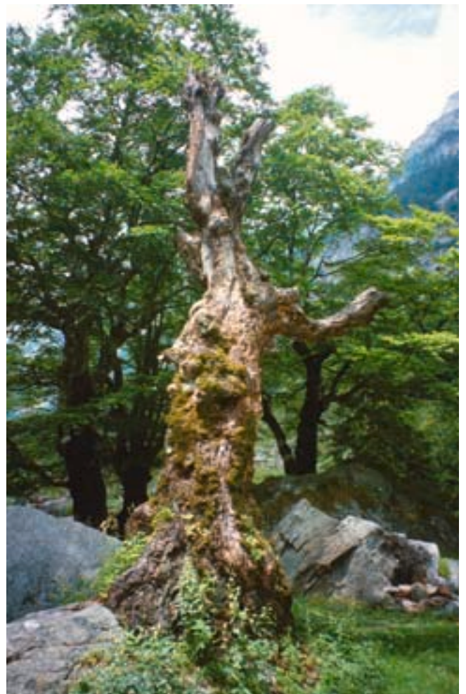
Abb. 2. Eine Uraltbuche im Verzascatal, aus der viele Alpenböcke ausgeschlüpft sind.