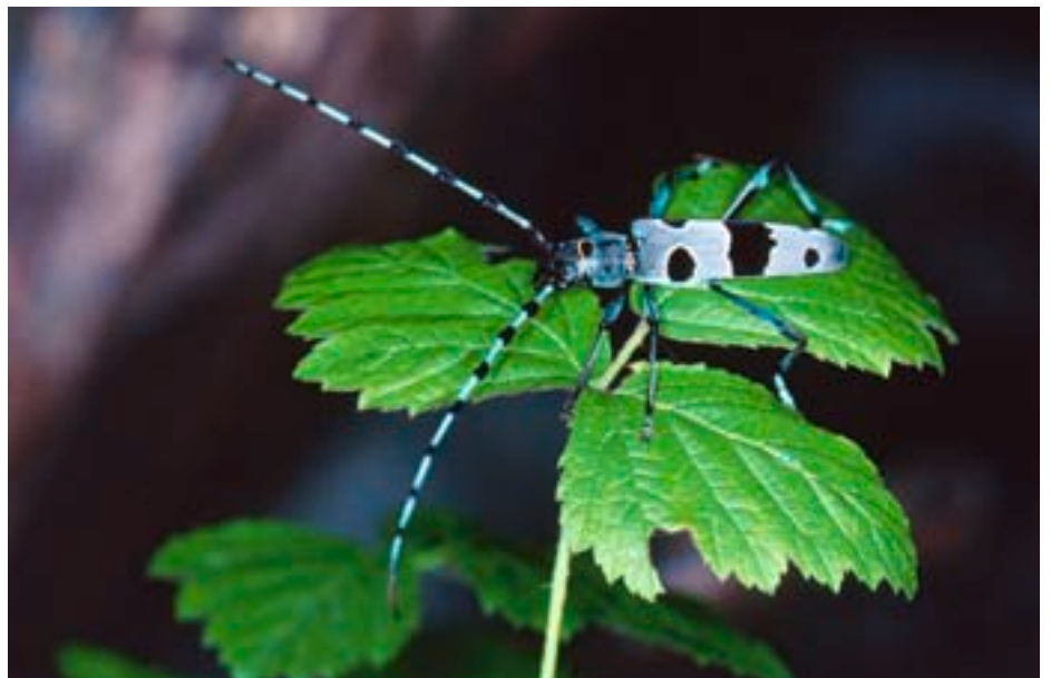
Abb. 6. Die Männchen besitzen Fühler, die fast doppelt so lang wie der Körper sind.