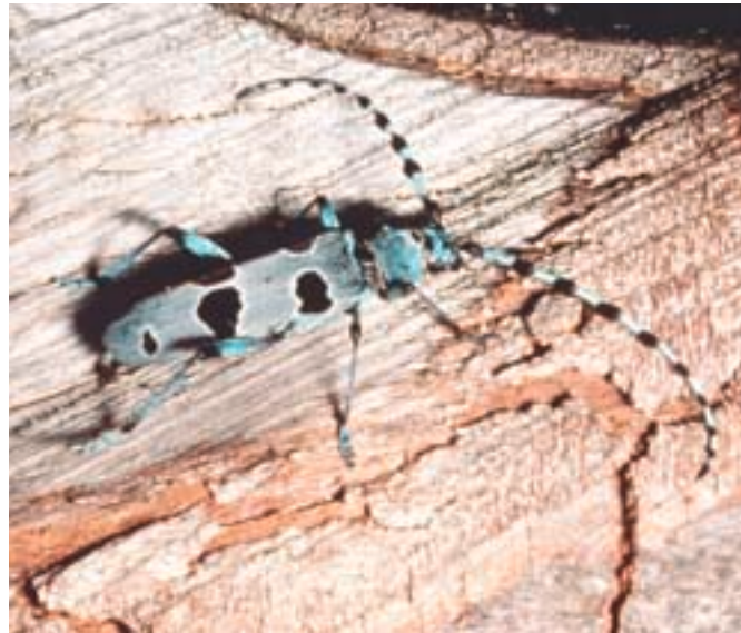
Abb. 9. Beim eigentlichen Vorgang der Eiablage legt das Weibchen seine Fühler nach hinten (auf dem Bild nur wenig ausgeprägt; Bild P. Duelli).