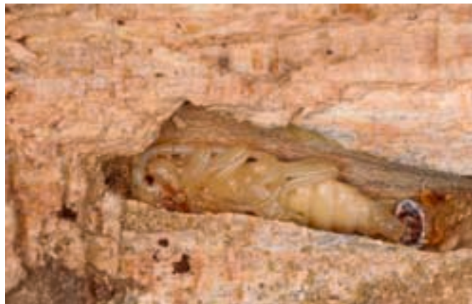
Abb. 12. Puppe des Alpenbocks. Die Beine und Fühler sowie die Flügelscheiden sind bereits gut sichtbar.

Wie bei den meisten Insekten können besonders die Larven und Puppen des Alpenbocks von insektenpathogenen Pilzen befallen werden, sodass sie während der Entwicklung absterben. Spezialisierte Schlupfwespen (Braconidae, Ichneumonidae) vermögen junge, noch nahe bei der Oberfläche fressende Bockkäferlarven zu orten und zu parasitieren. Wie viele andere Bockkäfer steht auch der Alpenbock zudem auf dem Speiseplan von Spechten (Abb. 14). Besonders der Buntspecht hat es auf die unter der Oberfläche liegenden Puppen abgesehen (GATTER 1997). Auch auf der Stammoberfläche stellen die Käfer einen Leckerbissen für grosse, Insekten fressende Vögel dar.