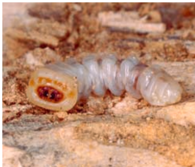
Abb. 10. Larve mit starken, versetzten Körperwülsten.