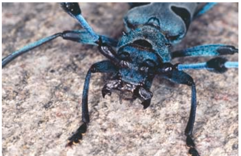
Abb. 7. Der Alpenbock besitzt kräftige Kiefer. Diejenigen des Männchens sind durch je einen seitlichen Dorn gekennzeichnet.