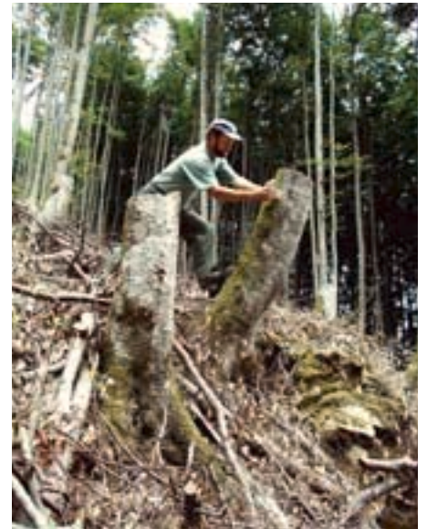
Abb. 18. Wenn bei einem Holzschlag hohe Strünke stehen gelassen werden, nützt das sowohl dem Alpenbock wie auch gegen Stein-schlag. Hier wird gerade ein in der Nähe auf Brennholz gefundener Alpenbock freigelassen.

Generell empfiehlt sich für die Förderung des Alpenbockes, alte, geschädigte oder abgestorbene Buchen an sonnigen Standorten stehen zu lassen (vgl. Abb. 2). Nach einem Holzschlag aufgearbeitete, für den Verkauf bestimmte Buchenstämme sowie Brennholzbeigen sollten vor dem Sommer, der Flugzeit der Alpenböcke, abgeführt oder im Schatten gelagert werden. In Windwurfflächen können einzelne Buchenstrünke oder Stämme minderer Qualität belassen werden. Auch bei Holzschlägen sollten einzelne alte Buchen und hohe Baumstrünke (Abb. 18) stehen bleiben. Zudem können Stammstücke an besonnten Stellen an stehende Bäume angelehnt und befestigt werden. Am Boden liegendes Holz und kleine Strünke sind für die Entwicklung des Alpenbockes ungeeignet.