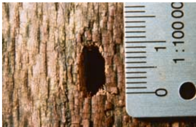
Abb. 13. Das Ausbohrloch misst rund 10 mm in der Länge und liegt parallel zur Faserrichtung des Holzes.

Der Alpenbock kommt in Mitteleuropa in warmen, montanen bis subalpinen Buchenwäldern auf rund 500 bis 1500 Metern über Meer vor. Die Eiablage erfolgt hier fast ausschliesslich auf Buchen ( Fagus sylvatica L.). Aber auch an Bergahorn ( Acer pseudoplatanus L.) wurden schon Larvengänge festgestellt (GERBER 1998). Nach BENSE (1995) entwickelt sich der Käfer im Süden auch in Ulmen ( Ulmus ), Hagebuchen ( Carpinus ), Linden ( Tilia ), Edelkastanien ( Castanea ), Eschen ( Fraxinus ), Walnuss ( Juglans ), Eichen ( Quercus ), Weiden ( Salix ), Erlen ( Alnus ) und Weissdorn ( Crataegus ). Er bevorzugt anbrüchiges, kränkelndes bis totes Buchenholz, sowohl als Strünke als auch als stehende, gebrochene oder liegende Stämme oder dicke Äste. Sie müssen jedoch gut