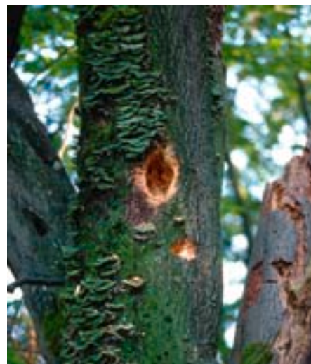
Abb. 14. Wie andere Bockkäferlarven stehen auch die Larven des Alpenbocks auf dem Speiseplan von Spechten.