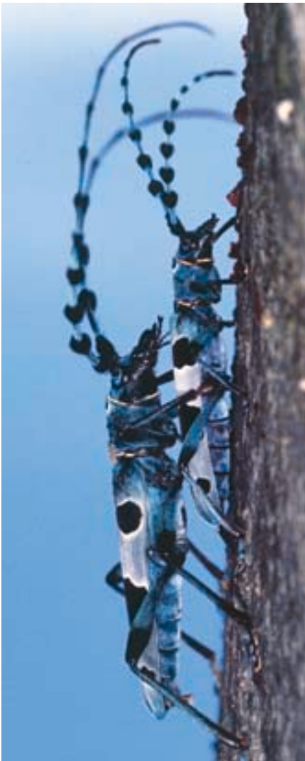
Abb. 8. Nach der Kopulation bewacht das Männchen sein Weibchen einige Zeit gegen allfällige Nebenbuhler.

Die Käfer schlüpfen an den Südhängen des Jura bereits Ende Juni, meist aber im Juli bis anfangs September mit einem Höhepunkt im August. Sie hinterlassen auf der Oberfläche die typischen ovalen Löcher vieler Bockkäferarten. Der Ausbohrgang liegt senkrecht zur Oberfläche, die Löcher sind zwischen 6 und 11 mm lang und 4 bis 7 mm breit. Die Längsachse der Fluglöcher liegt immer parallel zur Stamm-