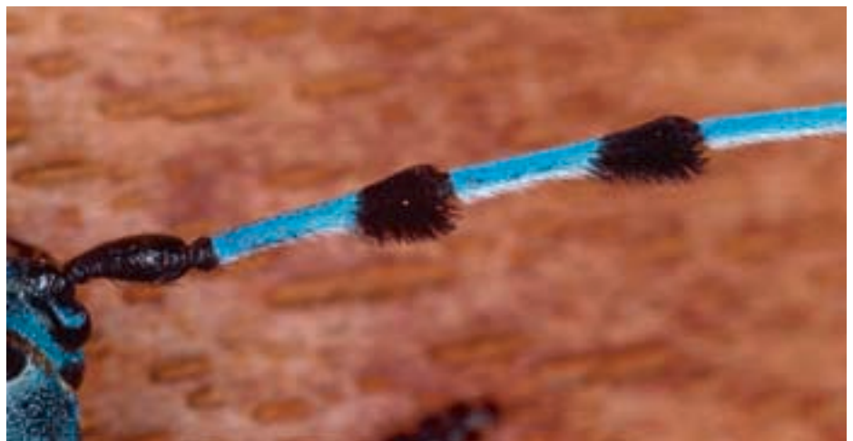
Abb. 4. Fühler mit den typischen Haarbüscheln an den Enden der einzelnen Glieder.

Der 14 bis 38 mm grosse Käfer ist unverwechselbar. Körper und Flügel sind von graublauer bis leuchtend hellblauer Farbe, die Flügeldecken weisen hell umrandete, schwarze Flecken auf. Grösse und Form dieser Flecken sind variabel, die mittleren Flecken sind meist zu einer Querbinde vereinigt. Mittels der Fleckenmuster können die Individuen unterschieden werden. Auffällig sind auch die langen Fühler (Antennen) mit den charakteristischen Haarbüscheln an den dritten bis sechsten Antennengliedern (Abb. 4). Die Geschlechter lassen sich anhand der Antennen und der Oberkiefer (Mandibeln) gut unterschei-