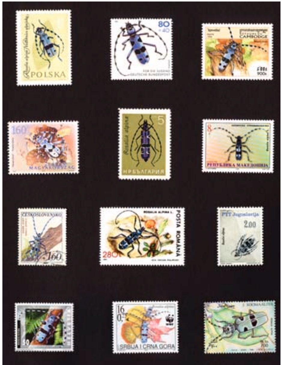
Abb. 17. Seiner Schönheit verdankt es der Alpenbock, dass er Marken aus vielen Ländern schmücken durfte.

Die Insekten sind vor allem mit Tagfaltern wie dem Schwalbenschwanz in der Liga der Flagship-Arten vertreten. Doch heute gehört der Alpenbock in Europa mit Sicherheit auch dazu. Er ist in zwölf Ländern auf Briefmarken dargestellt (Abb. 17). Auch die Schweizer Post widmete ihm im Jahr 2002 eine 50-Rappen Marke. Im Jahre 2001 war er das «Insekt des Jahres» in Österreich, und er ist eine der 149 «Smaragd-Arten» des WWF Schweiz (www.wwf.ch/smaragd).