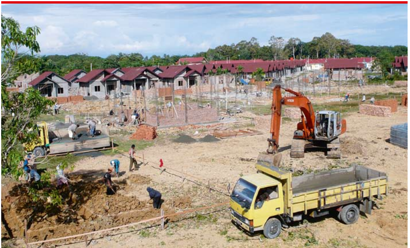
1048 Häuser für Tsunami-Opfer: Bauarbeiten für die Siedlung Belang Beurandang ausserhalb von Meulaboh.

Bettina Iseli, Programmverantwortliche für die Programme im indonesischen Meulaboh