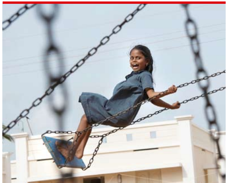
Auf dem Spielplatz von Kanyakumari: Fünf Jahre nach dem Tsunami herrscht in den neuen Siedlungen ein reger Alltag. Die Zuversicht ist zurückgekehrt.