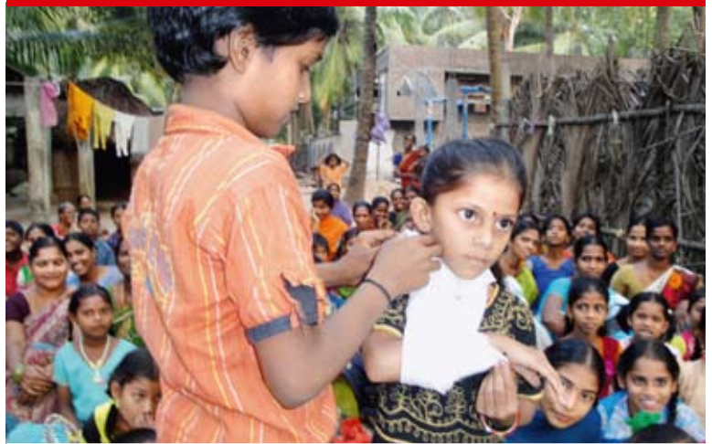
Auch Kinder gehören zu den Katastrophenbereitschaftsteams und lernen zum Beispiel, wie sie sich gegenseitig Erste Hilfe leisten können.

Nach der Nothilfe und der gemeinsamen Planung reparierten lokale Bootsbauer unter Aufsicht der Fischer 1619 Boote. Gemeinsam wurden 1334 Netze eingekauft und 123 Salzfelder instand gestellt. Parallel lief die Bildung und Ausbildung von Katastrophenbereitschaftsteams in allen Dörfern und der Aufbau der Dorfgemeinden, die nicht nur Gemeindefragen sondern auch Familienkonflikte lösen. Weiter wurden Gesundheitshelferinnen und Alphabetisierungsverantwortliche ausgebildet. Alle Dörfer haben heute Strom und zementierte Wege, niemand versinkt mehr im Sumpf während den starken Regenfällen. Fünf Inseldörfer haben Taxiboote erhalten. Die Grundschule findet hier erstmals regelmässig statt, seit dorfeigene Grundschullehrerinnen ausgebildet wurden. Die staatlich angestellten Lehrer scheuten den mühsamen Weg auf die Inseln und erschienen nur unregelmässig.