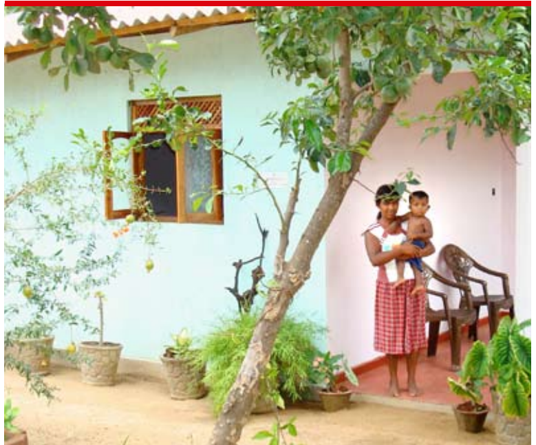
Neues Leben nach der Katastrophe: Frau vor ihrem Haus in Ampara.

Die Tsunami-Projekte in Sri Lanka konnte Caritas Ende 2008 abschliessen. Zurzeit unterstützt Caritas Opfer der Vertreibungen vom Frühjahr 2009 bei ihrer Rückkehr in ihre angestammten Wohnorte.