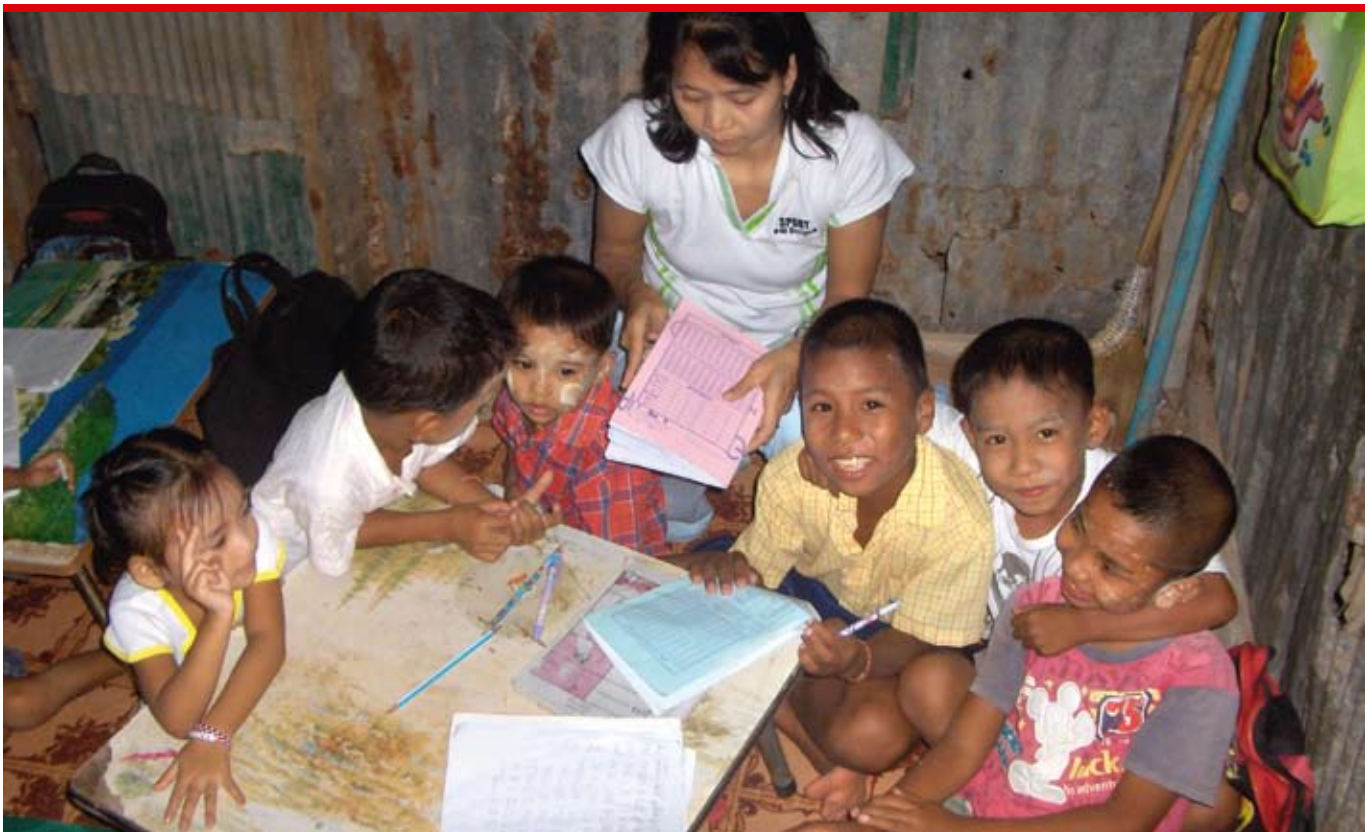
Kinder von burmesischen Flüchtlingen werden so lange in Spezialkursen unterrichtet, bis sie die öffentliche Schule besuchen können.

In einer besonders prekären Situation sind in Thailand Migrantinnen und Migranten aus Burma, die vor Krieg und existentieller Not geflohen sind. Durch die Unterstützung von Sozialarbeitern, die Thai und Burmesisch sprechen, erhalten die Flüchtlinge Zugang zum staatlichen Gesundheitswesen. Die Kinder der Migranten-Familien erhalten Unterricht im Lesen und Sprechen von Thai. Kinder, welche genügend Thai können, werden in die öffentliche Schule integriert. Auch Erwachsene erhalten Sprachunterricht. Dies ermöglicht ihnen, besser mit ihren Arbeitgebern und mit öffentlichen Stellen zu kommunizieren und ihre Grundrechte einzufordern.